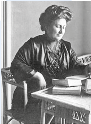
Maria Montessori (Reformpädagogin, 1870 - 1952)

Die Überzeugung von der Selbsttätigkeit des Kindes und einem jedem einzelnen Kind immanenten Bauplan seiner Entwicklung bildet die Grundlage ihres Werkes.